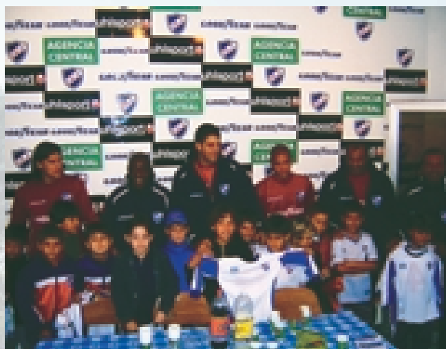
El plantel principal entregando las camisetas a la Categoría 97 de Fútbol Infantil